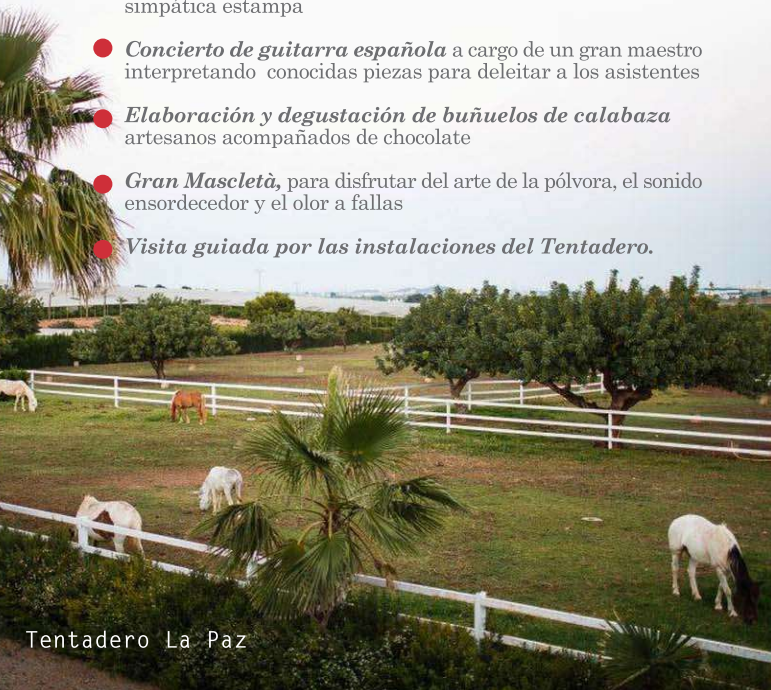
Tentadero La Paz