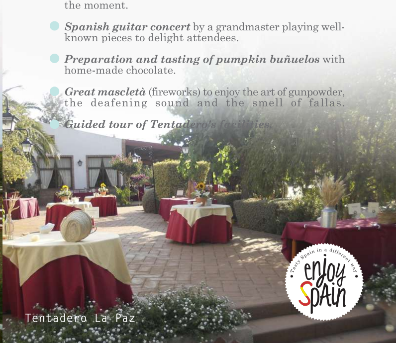
Tentadero La Paz